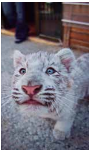
Mundo Park Sevilla