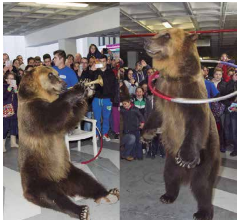
Tima en Cash Mascota, Centro Comercial Alameda (Granada)

En relación a los primates, el Real decreto 1881/1994 , de 16 de septiembre , impide su tenencia en manos de particulares.