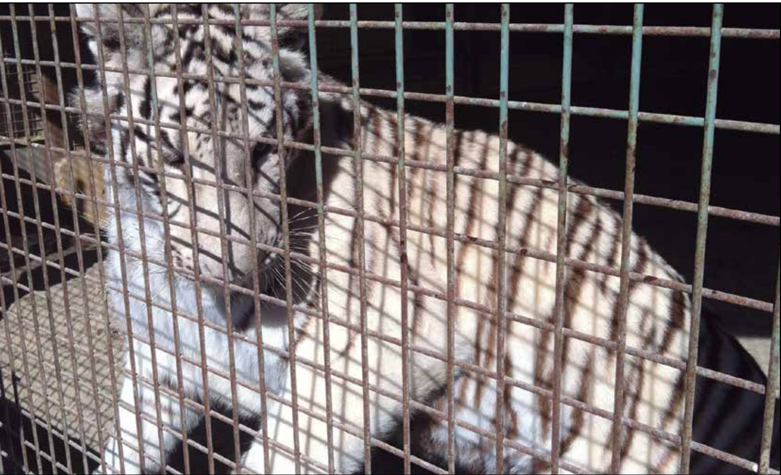
Zoo Exóticos Kiko