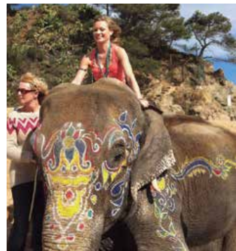
Noa en un rodaje