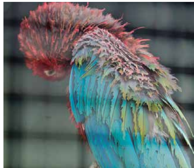
Mundo Park Sevilla