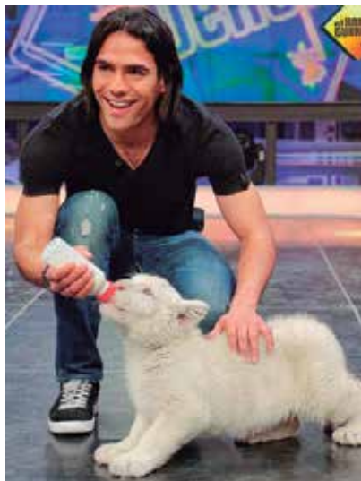
Tigre blanco de Mundo Park Sevilla en el plató de “El Hormiguero”