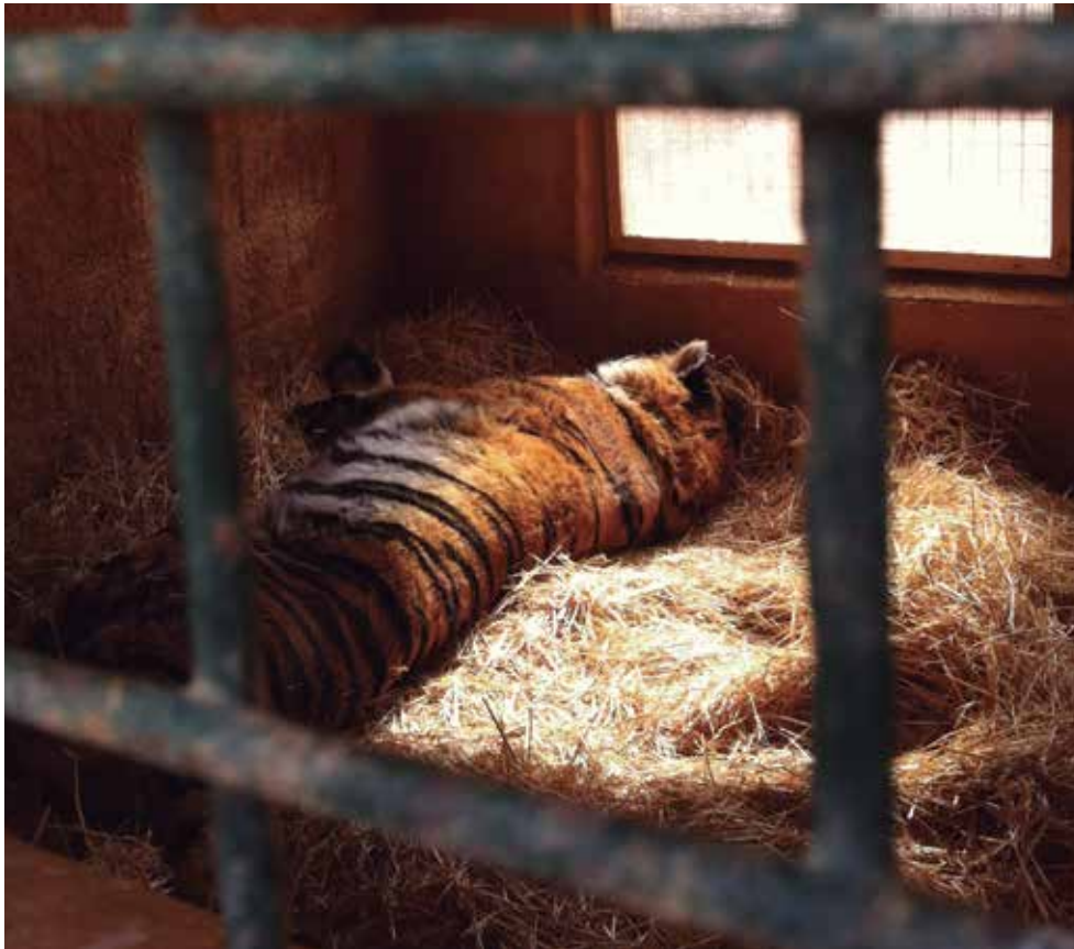
Fauna y Acción