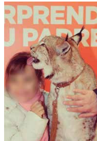
Evento L'Oreal Día del Padre 2013