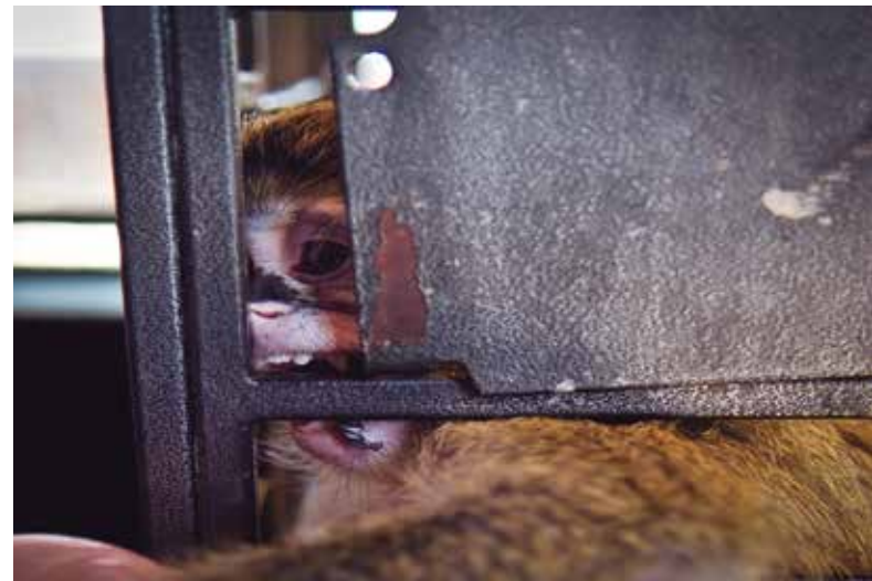
Mundo Park Sevilla

Las condiciones de vida y el trato a los animales en Zoo Mundo Park de Sevilla salieron a la luz en 2012 gracias a una investigación de la ONG Igualdad Animal . Igualdad Animal logró acceder a la parte del zoo que no está abierta al público , donde grabó animales en jaulas sucias y reducidas , muchos presentando comportamientos estereotipados (anormales y repetitivos)-.