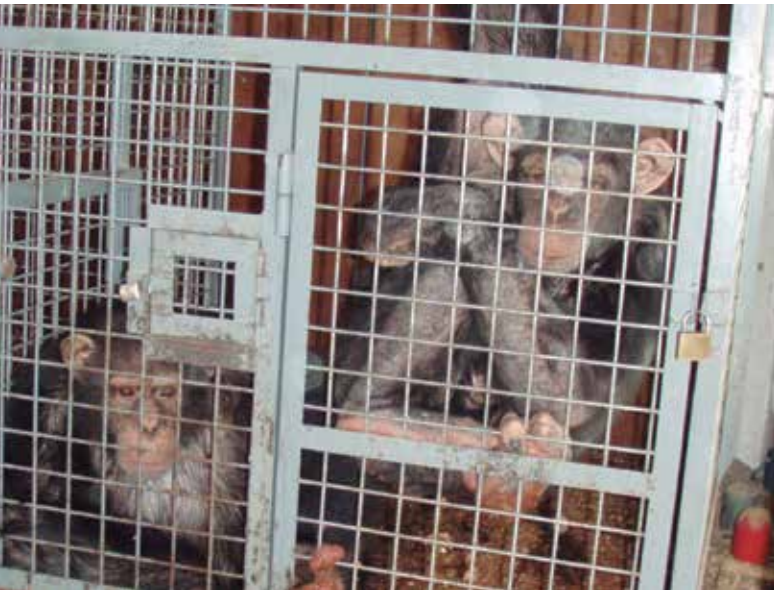
Arriba: Tarzán y Loti Derecha: Zoo Exóticos Kiko

Las duras condiciones ambientales y psicológicas en las que son obligados a vivir pueden causarles traumas y problemas psicológicos que les marcan para el resto de sus vidas.