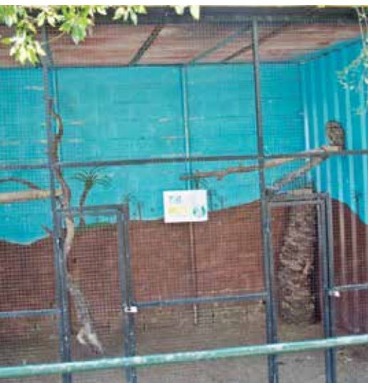
Mundo Park Sevilla

Otros animales procedentes de este centro son el león del anuncio Me siento seguro de Groupama Seguros y los cachorros de leones que fueron alquilados para una fiesta en casa de Kiko Rivera (30 diciembre 2013). Con respeto a este último suceso, el Seprona de la Guardia Civil comprobó que Mundo Park no disponía del permiso de la Consejería de Medio Ambiente de la Junta de Andalucía para poder exhibir públicamente estos animales, así que se formalizó la denuncia administrativa y se procedió a la retirada de los cachorros.