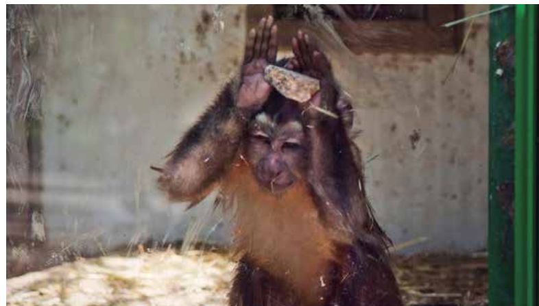
Mundo Park Sevilla

Estos argumentos también los podemos aplicar a otros animales exóticos como leones, tigres, elefantes u osos ”.