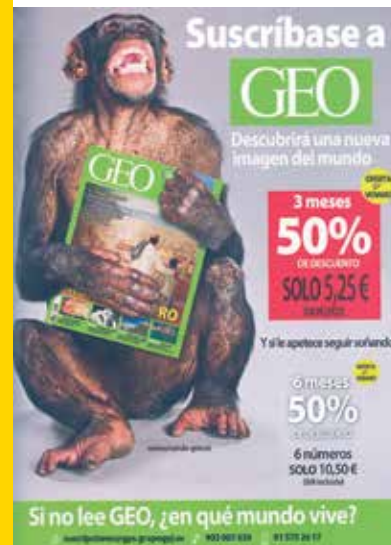
Chimpancé sin colmillos en la portada de la revista GEO