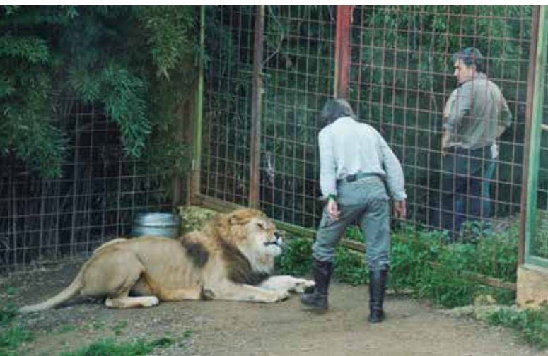
Mundo Park Sevilla

Además, para que los entrenadores puedan “hacerlos más suyos”, es práctica habitual separarlos de sus madres a muy temprana edad. Se les cría a biberón para que hagan la impronta con su propietario en vez de con su madre real y lograr que les obedezcan. Aún así, cuando llegan a la madurez sexual estos animales suelen tornarse agresivos incluso con las personas que los han cuidado desde pequeños.