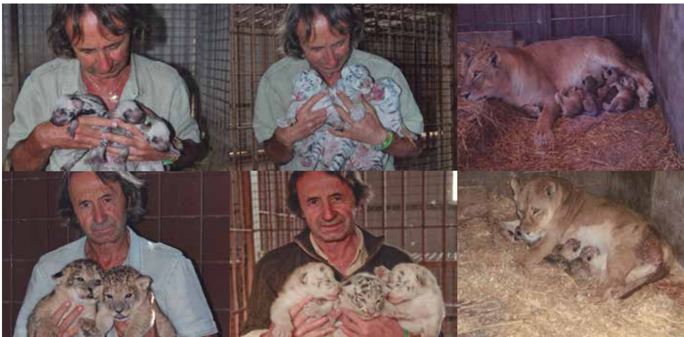
Arriba: Mundo Park Julio 2013 (Foto 1 y 2).

Muchas empresas de alquiler de animales presentan a sus cachorros como “huérfanos”. La mortalidad de los animales mantenidos en cautividad -especialmente aquellos en condiciones inapropiadas- es más alta que la que se daría en la naturaleza. Sobretodo durante los partos, porque las madres no han aprendido -cómo lo habrían hecho en la naturaleza de otros miembros de su manada- cómo cuidar de las crías y no saben reaccionar.