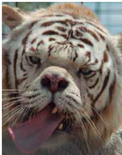
Kenny, tigre blanco con síndrome de down