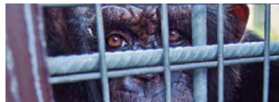
Mundo Park Sevilla