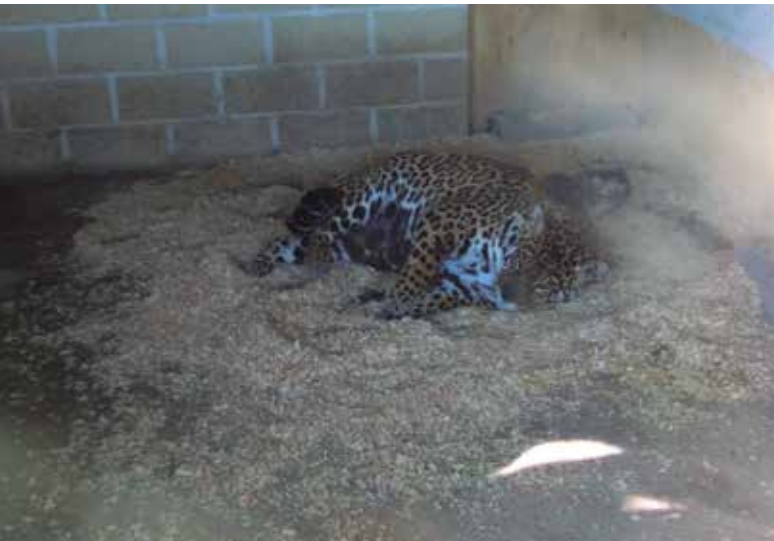
Zoo Exóticos Kiko