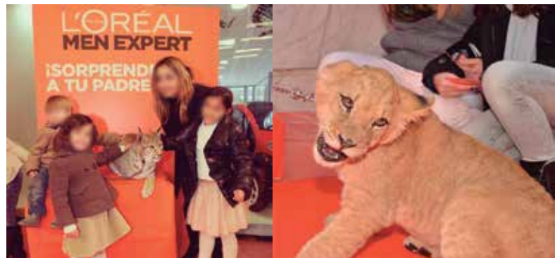
Evento L'Oréal Día del Padre 2013

Aunque desde FAADA nos gustaría pensar que no debería ser necesario incluir este punto, todavía hay producciones que intencionadamente maltratan y matan animales como es el caso de la película Blancanieves , de Pablo Berger, para cuya filmación se torearon y mataron diversos toros. Para colmo, la película arrasó en la ceremonia de los Goya de 2013 , pese a la denuncia incoada por las principales organizaciones de defensa animal españolas unidas en la Plataforma La Tortura No es Cultura .